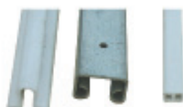
Système de clipsage de bche